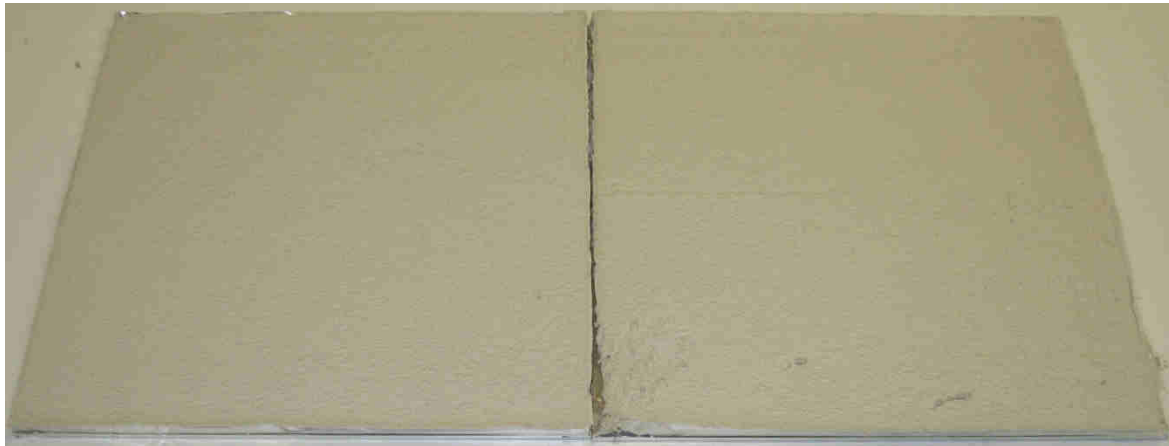
A007: LuftporenPutz LL 66/Plus