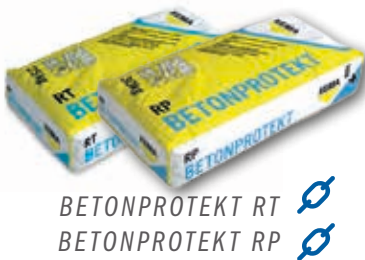
BETONPROTEKT RT BETONPROTEKT RP