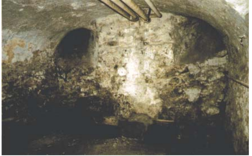
Tyypillistä huonon tiiveyden omaaville seinärakenteille: kosteus tunkeutuu rakenteisiin ja hajoittaa sen.