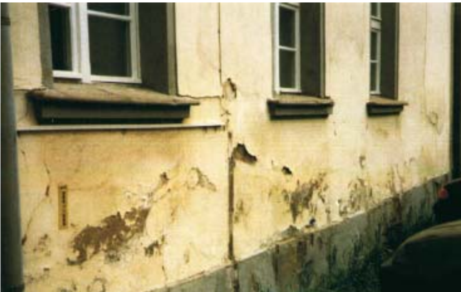
Teiden varsilla olevat rakennukset joutuvat alttiiksi tiesuolalle ja normaalia suuremmalle kosteudelle.