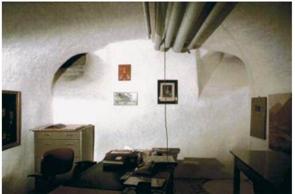
Saneeratut seinärakenteet pysyvät kuivina ja pinnoitteet kestävät.

Bayosan Saneerausjärjestelmän kaikki komponentit sopivat saumattomasti yhteen. Järjestelmän perustana on erittäin tehokas ja käytännössä hyväksi todettu BAYOSAN Saneerauslaasti. Laastin erityisominaisuuden ansiosta siirtyä vaurioita aiheuttava haihtumisalue laastintaaimmaiseen osaan, jossa veden mukana tuleville suoloille on tarpeeksi tilaa kiteytyä huokosissa. Näin seinärakenteissa ei tapahdu vaurioita ja rakenne pysyy kuitenkin diffuusiokykyisenä. Laasti ja maali pysyvät kuivina.