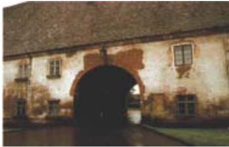
Monet historialliset rakennukset kärsivät kosteista, suolaisista seinärakenteista.