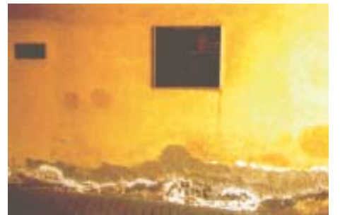
Kosteus ja suolat valtaavat seinärakenteet.